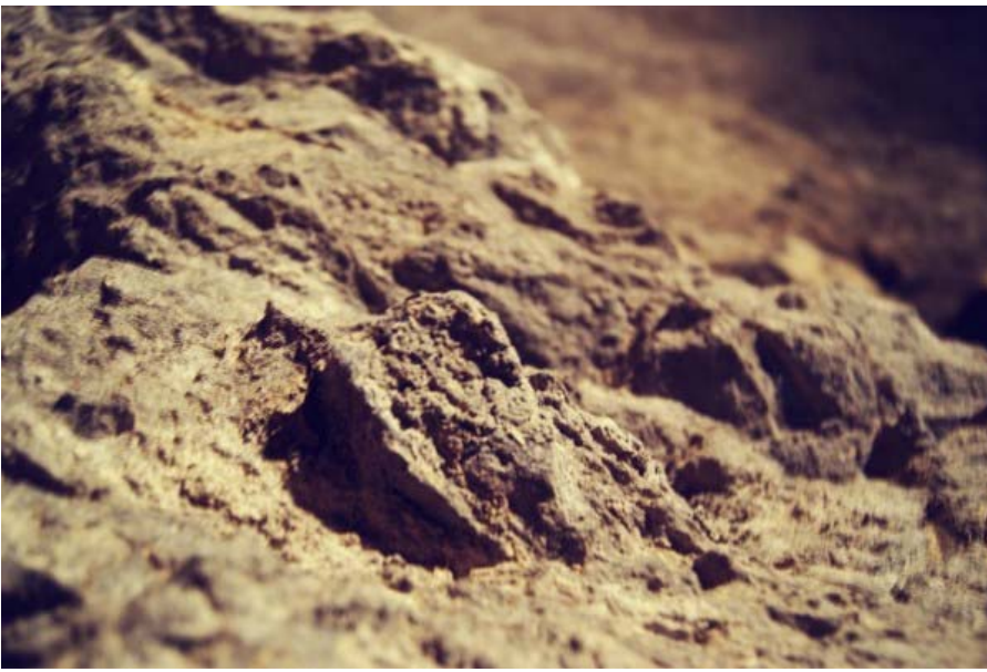
Le Fort de Vaise fait parti de la première ceinture de Lyon, c'est à dire un ensemble de forts construit entre 1830 et 1870 dans la région