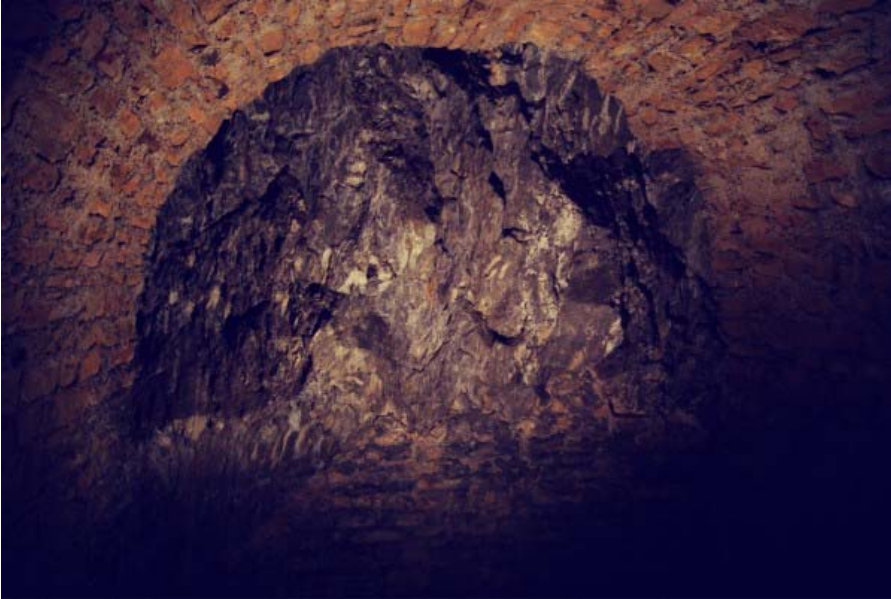
Cette galerie, cachée sous le fort de Vaise, est accessible depuis le boulevard Saint Exupéry, dans le 9ème arrondissement de Lyon