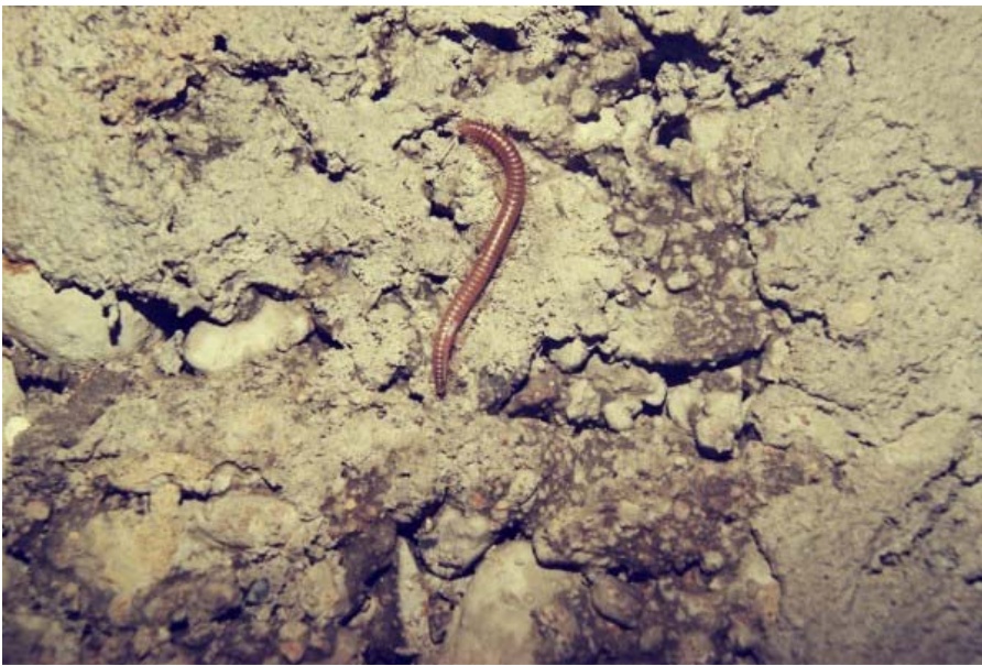
Les souterrains sont habités par quelques insectes